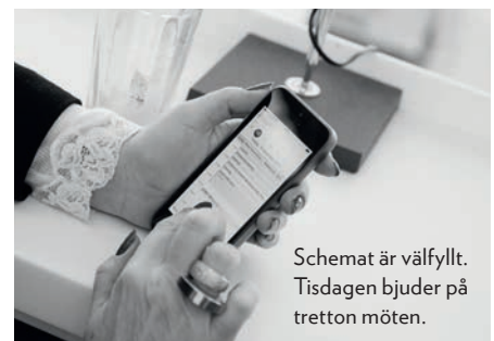
Schemat är välfyllt. Tisdagen bjuder på tretton möten.