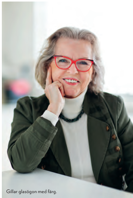
Gillar glasögon med färg.

– Det är för mig ett mycket större problem, när man resonerar i ”vi” och ”dem”.